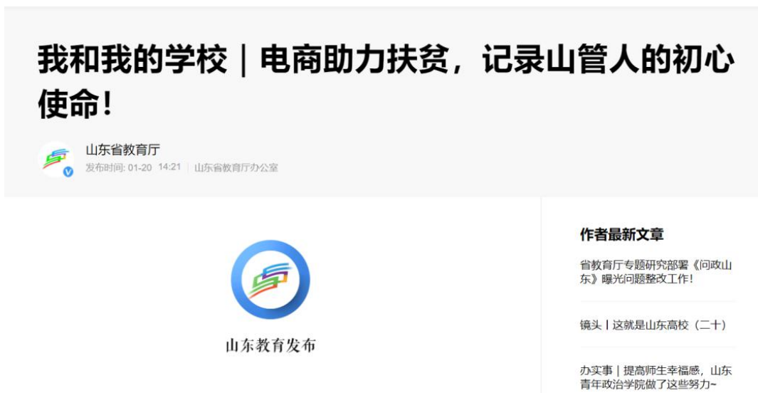
图7 山东省教育厅报道

https://baijiahao.baidu.com/s?id=1689385637356324902&wfr=spider&for=pc