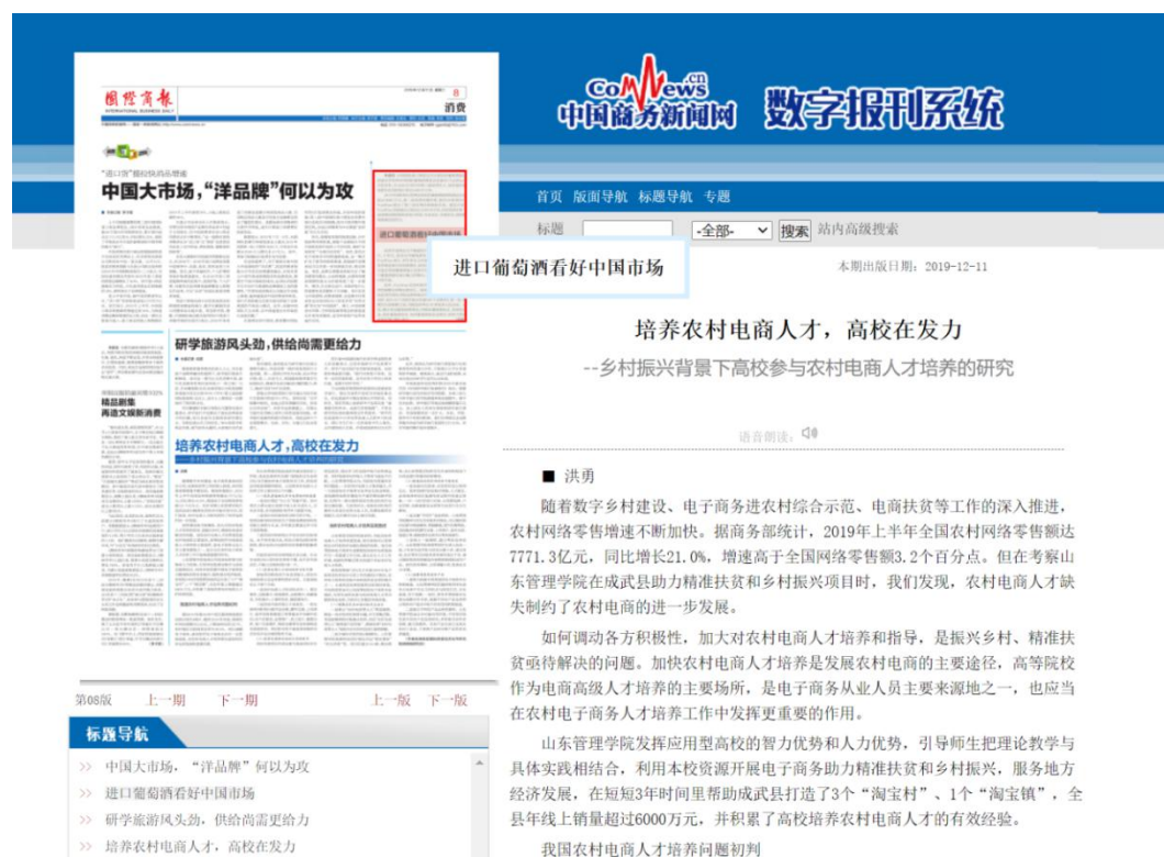
图 5 国际商报报道