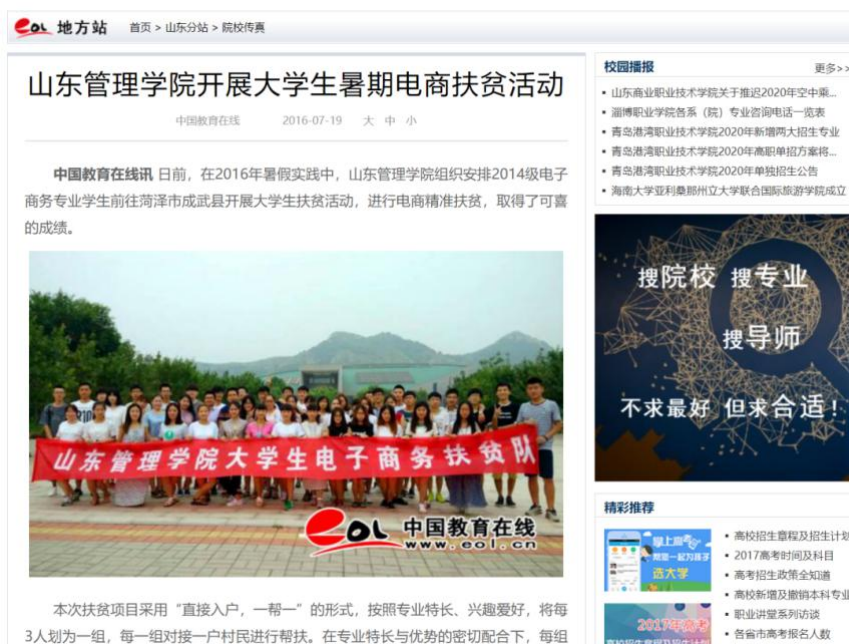
图 9 中国教育在线报道

https://www.eol.cn/shandong/yuanxiaochuanzhen/201607/t20160719_1431697.shtml 山东管理学院开展大学生暑期电商扶贫活动