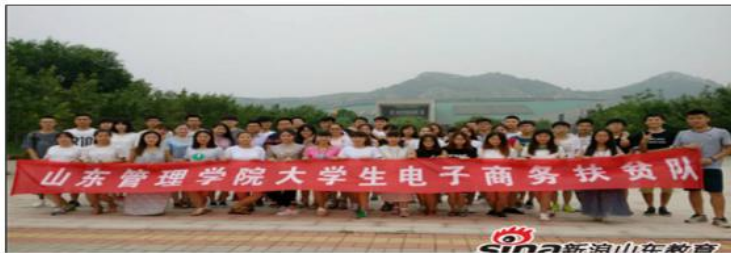
图 11 新浪网报道

近日,山东管理学院组织安排2014级电子商务专业学生前往菏泽市成武县开展大学生扶贫暑假实践活动,进行电商精准扶贫,取得了可喜的成绩。