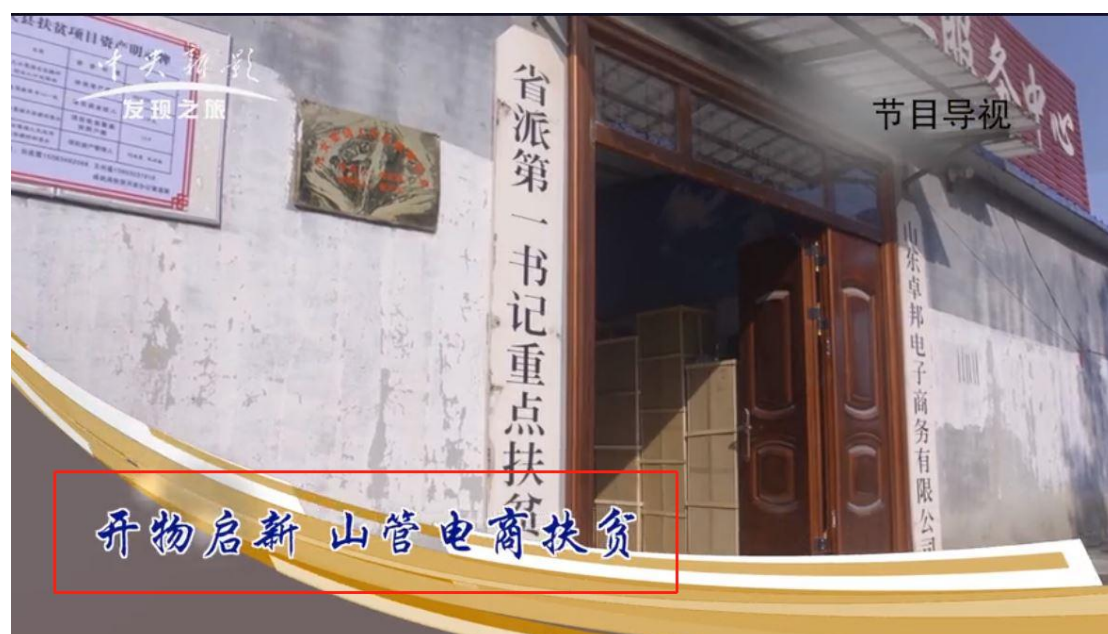
图1 中央电视台发现之旅频道报道

网址为： https://mp.weixin.qq.com/s/_5Ee1KqO4p_M-dhB3XYXdA