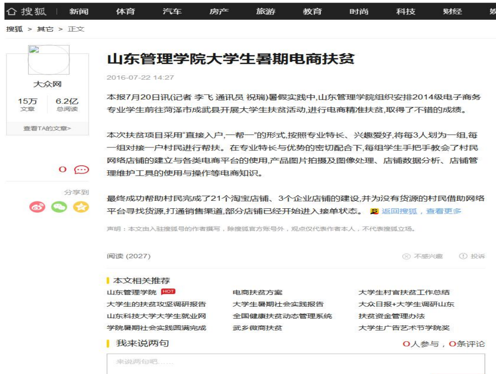
图 12 搜狐网报道

网址为: http://www.sohu.com/a/107123888_119700