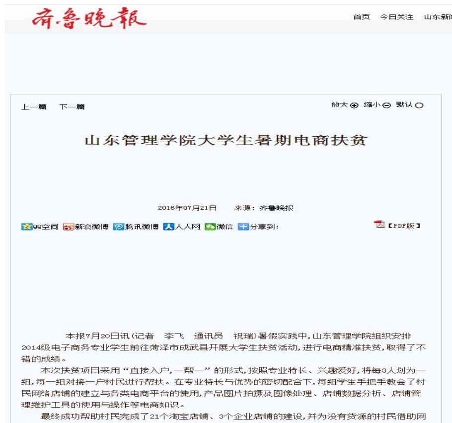
图 10 齐鲁晚报报道

http://epaper.qlwb.com.cn/qlwb/content/20160721/ArticleC07006FM.htm