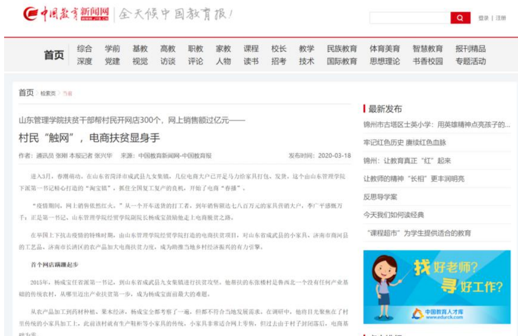
图4 中国教育报报道

山东管理学院扶贫干部帮村民开网店 300 个，网上销售额过亿元—— 村民“触网”，电商扶贫显身