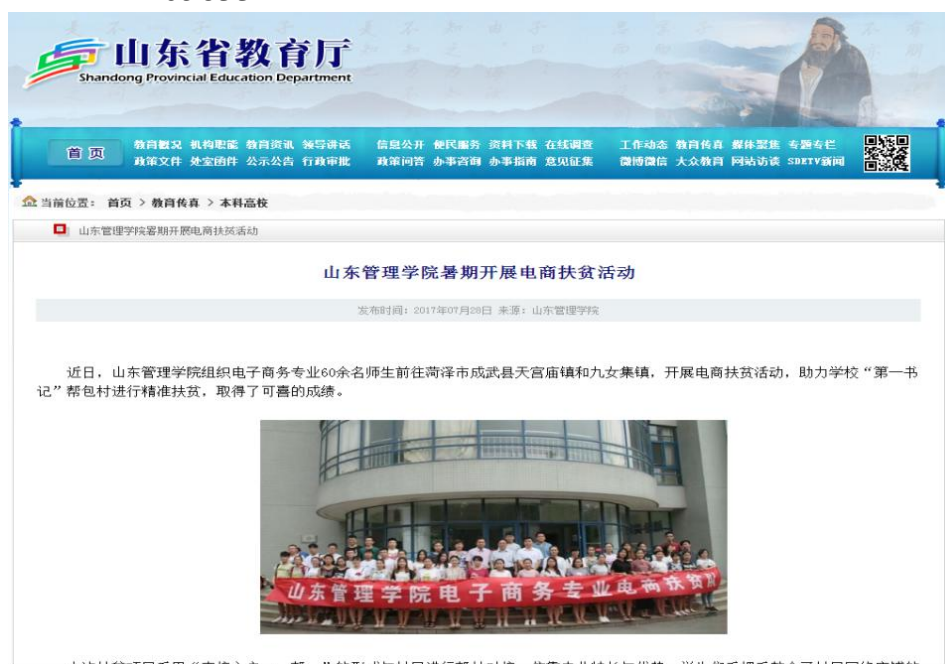
图 8 山东教育厅报道

http://www.sdedu.gov.cn/eportal/ui?pageId=465425&articleKey=1068166&columnId=465833